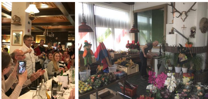
Ein fröhliches Fest und die Liquidation im Elefant