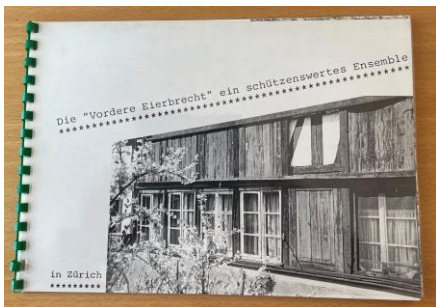
Broschüre Eierbrecht Reno Casetti