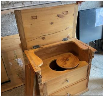
Schlafzimmermöbel für Nachttopf Bauernhof Weber ca. 1930

Unsere Sammlung konnten wir auch in diesem Jahr wieder um einige interessante Objekte erweitern. Hierzu eine Auswahl.