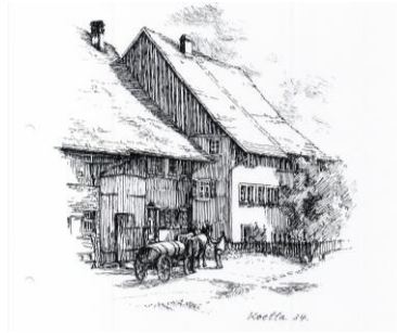
Litho Berghaldenstrasse 1934 mit Fuhrwerk, Alfred Koella