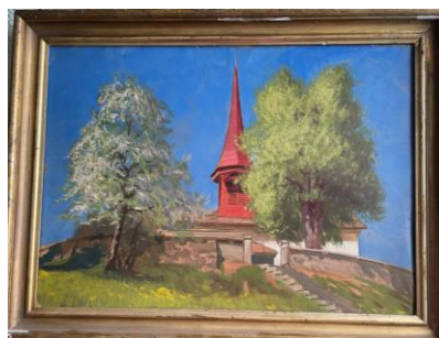
Bild Alte Kirche Witikon