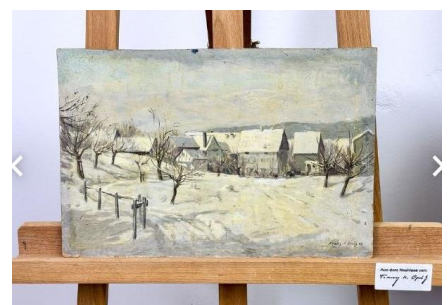
Ansicht Meyerhof vom Schulerweg